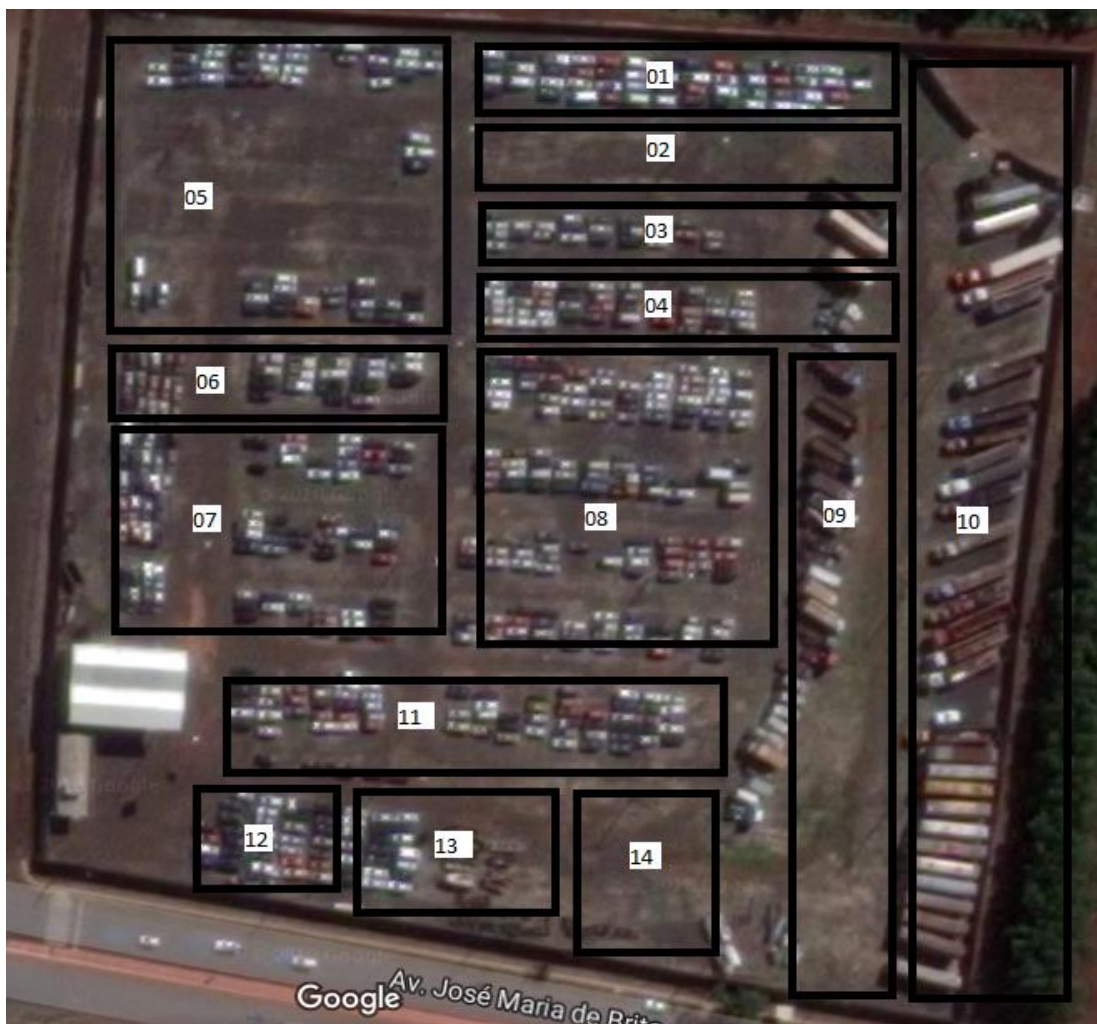
01) Veículos vinculados a inquéritos do ano de 2017;

Conforme a solicitação de algumas Varas Federais de Foz do Iguaçu/PR para separarmos os seus veículos em um mesmo espaço, estamos remanejando os veículos e o pátio possivelmente estará organizado conforme croqui abaixo, dependendo da quantidade de veículos de cada vara.