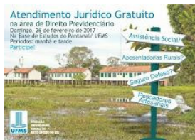
ajufe 2018 - ufms - 1.jpg 226K