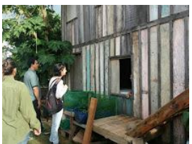
ajufe 2018 - ufms - 4.jpg 119K