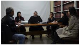
ajufe 2018 - ufms - 10.jpg 99K