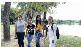
ajufe 2018 - ufms - 2.jpg 111K