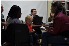
ajufe 2018 - ufms - 11.jpg 91K