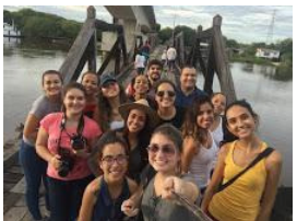
ajufe 2018 - ufms - 3.jpg 92K