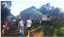
ajufe 2018 - ufms - 8.jpg 138K