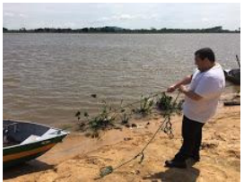
ajufe 2018 - ufms - 7.jpg 125K