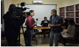
ajufe 2018 - ufms - 9.jpg 85K