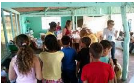
ajufe 2018 - ufms - 6.jpg 78K