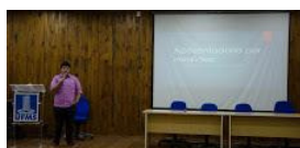
ajufe 2018 - ufms - 12.jpg 926K