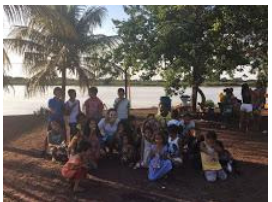
ajufe 2018 - ufms - 5.jpg 151K