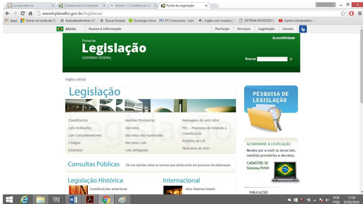
Imagem n.º 04: Localização de informação no corpo do texto por meio do recurso “CTRL+F” no site do Planalto.